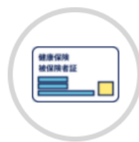
保険証 ※保険診療のみ必須