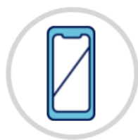
スマホ ※パソコンも利用可