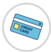
クレジットカード